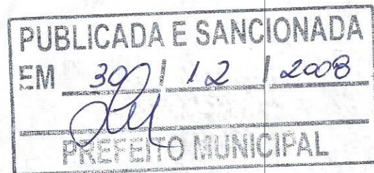
Luiz Balbino Moreira Prefeito Municipal